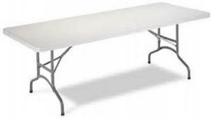
MAHAIK 1,80 X 0,80 ZM