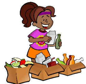
NIK BIRZIKLATZEN DUT, ETA ZUK?

ETA ZURE EKITALDIAREN KUDEAKETA ERREZTEKO BURURATZEN ZAIZUN GUZTIA...!!!