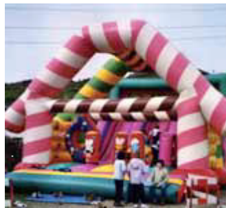
PUZGARRIAK Tainu, forma eta kolore sorta ugaria