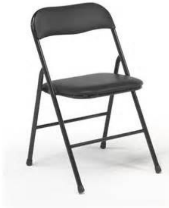
MAHAIK 1,80 X 0,80 ZM