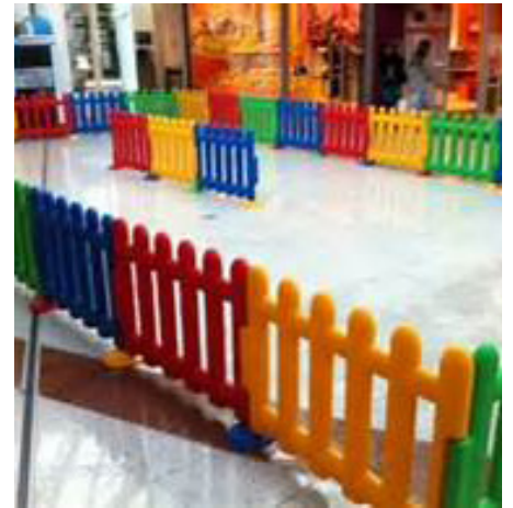
MAHAIK 1,80 X 0,80 ZM