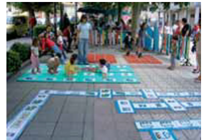
TXIKI GUNE NEURRI GUZTIETAKOAK