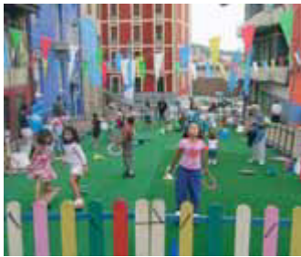
TXIKI GUNE NEURRI GUZTIETAKOAK